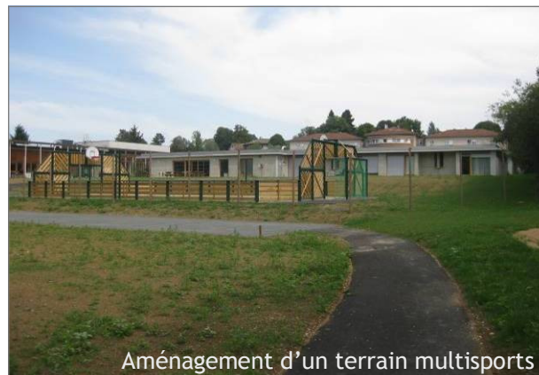
Aménagement d'un terrain multisports